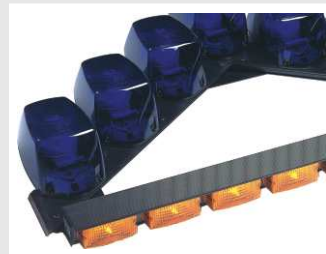
Vector de 7 módulos con Signalmaster de 8 módulos