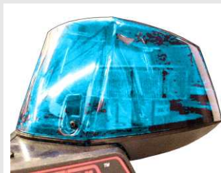
Módulo luces prioritarias de LEDs Sputnik

SCS1000-PA, kit de megafonía para sirenas compactas SCS1000, mando remoto no estanco con funciones de volumen y micrófono.