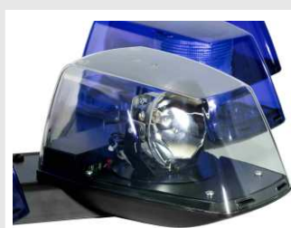
Módulo VisiVector, foco buscador