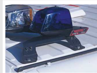
Fijación permanente a techo