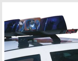
Fijación amovible mediante tirante