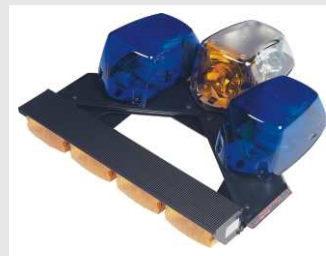
Vector de 3 módulos con Signalmaster de 4 módulos

Consultar configuración con el Departamento Comercial.