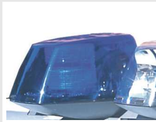
Módulo luces prioritarias estroboscópicas