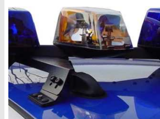
Conector techo de 19 o 23 vías