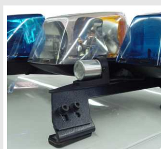
VL-CLD, Conjunto Luz Detención