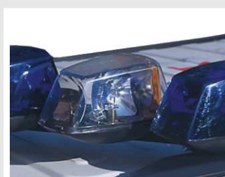
Módulo auxiliar con tres focos