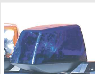
Módulo luces prioritarias rotativas halógenas