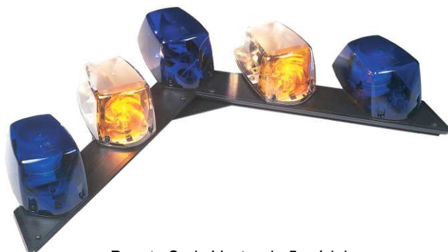
Puente Serie Vector de 5 módulos